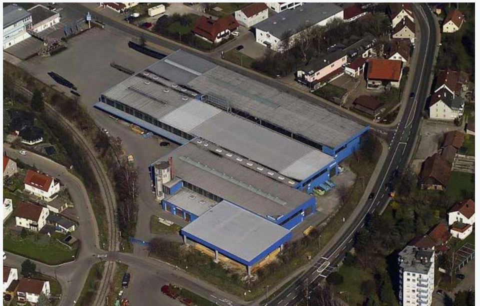
Die Firma Stephan von oben. Stephan beschäftigt heute 71 Mitarbeiter, davon 45 in der Produktion und sechs im Technischen Büro. Der Jahresumsatz beläuft sich auf zwölf Millionen Euro. Bild rechts unten: Die neue CNC-gesteuerte Multifunktionsbrücke.