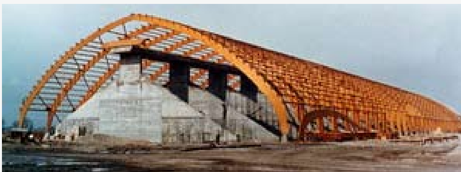
Oben und unten: BS-Holz-Konstruktionen können nicht nur gewaltige Ausmaße annehmen, sondern auch problemlos mit anderen Materialien kombiniert werden.

Bereits Ende der 60er Jahre stieg Stephan ins Auslandsgeschäft ein, baute unter anderem ein Sportzentrum in Jeddah in Saudi-Arabien und, zusammen mit einem Partner im Elsass, etwa 50 größere Projekte in Frankreich: Industrie- und Lagerhallen, Schwimmhallen und Kirchen. Seit 1976 wurde in Gaildorf gezielt modernisiert. Nach der Wende gründete Stephan eine Niederlassung in Thüringen, 1993 wurde in Heideiland-Königshofen gebaut. Die Zäsur kam 1998: Da abzusehen war, dass die Konjunktur einbrechen würde, entschied man sich, Teile des Baubetriebs in Stuttgart zu veräußern und in Gaildorf unter anderem in eine Leimbinderpresse mit Hobelinie zu investieren. Es war, rückblickend, die denkbar klügste Entscheidung. Denn als die Baukrise die Ingenieurholzbranche erreichte, hatte auch Stephan zu kämpfen. Der Umsatz fiel, der Markt geriet aus den Fugen, weil Unternehmen unter Insolvenzverwaltung Dumpingpreise boten - von der Zahlungsmoral der öffentlichen Hand zu schweigen. Stephan musste Personal reduzieren und sich neu ausrichten.