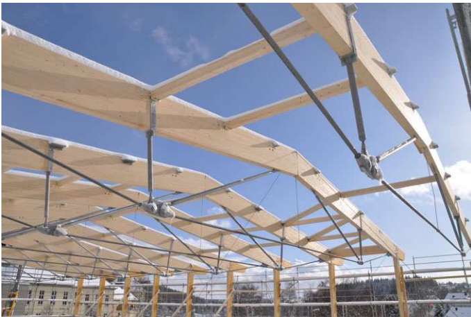
(Bild 1 – Gesamtbild)

Gerade in der Winterzeit behindert die Witterung oft den Baufortschritt. Dann macht es sich natürlich doppelt bezahlt, wenn man einen BS-Holz Hersteller wie STEPHAN mit einer breiten Dienstleistungspalette mit im Team hat. Denn montagefertig gelieferte Bauteile garantieren auch dann einen schnellen Baufortschritt.